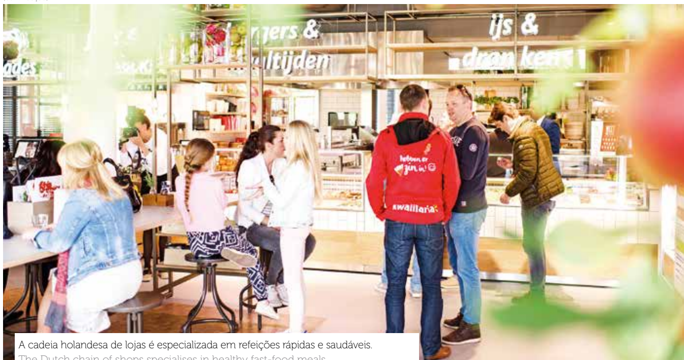
A cadeia holandesa de lojas é especializada em refeições rápidas e saudáveis. The Dutch chain of shops specialises in healthy fast-food meals.

A estratégia passou por remodelar o interior e o exterior das lojas. Desde a farda dos colaboradores até aos balcões e vitrinas dos espaços, tudo foi alvo de uma renovação, tendo sido utilizada madeira de carvalho, entre outros materiais robustos.