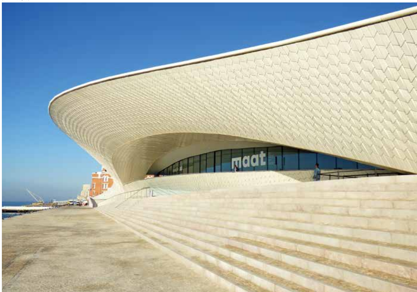
O MAAT pode ser visitado gratuitamente todos os dias (exceto às terças-feiras), entre as 12 e as 20h. MAAT can be visited free daily (except Tuesdays), between 12am and 8pm.

O estúdio AL_A procurou enquadrar a nova estrutura no património cultural e no futuro de Lisboa. O percurso pedonal da frente ribeirinha passa a incluir a cobertura do novo edifício, num movimento ondulante que se funde com a paisagem envolvente. A ampla fachada sul funciona como um grande refletor em interação com a luz do rio. O ângulo e a posição dos mosaicos são calculados de modo a criar efeitos luminosos específicos consoante o período do dia e do ano. A fachada norte, em vidro, inclui um sistema com vários níveis de transparência, adaptável aos diferentes usos do espaço. Os dois edifícios estão unidos por um parque, desenhado pelo arquiteto paisagista Vladimir Djurovic, que oferece um espaço exterior com circulação livre. No total, o MAAT ocupa uma área de 38 mil metros quadrados na zona ribeirinha de Belém, em Lisboa.