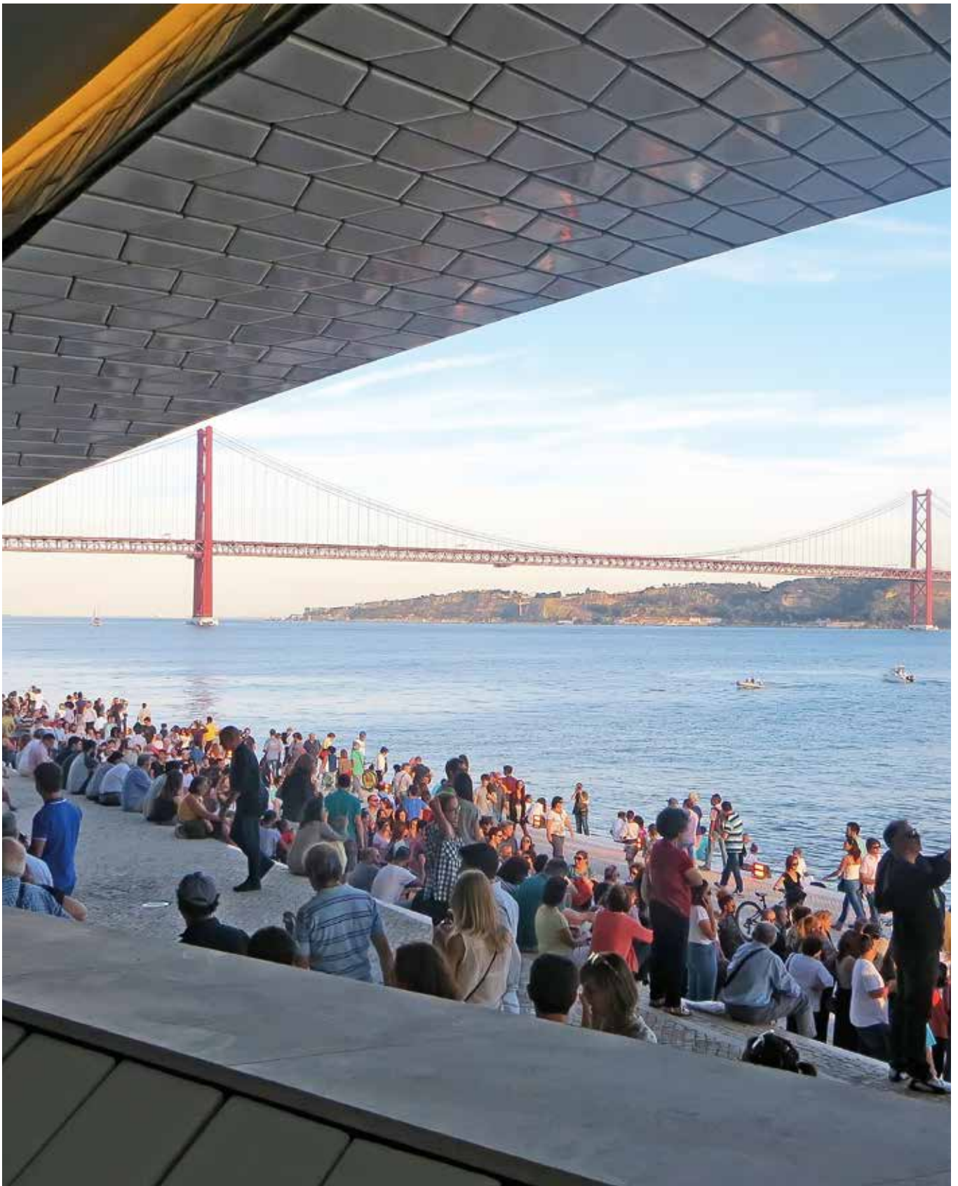
A Fundação EDP espera receber 250 mil visitantes por ano. The EDP Foundation expected to receive 250,000 visitors a year.