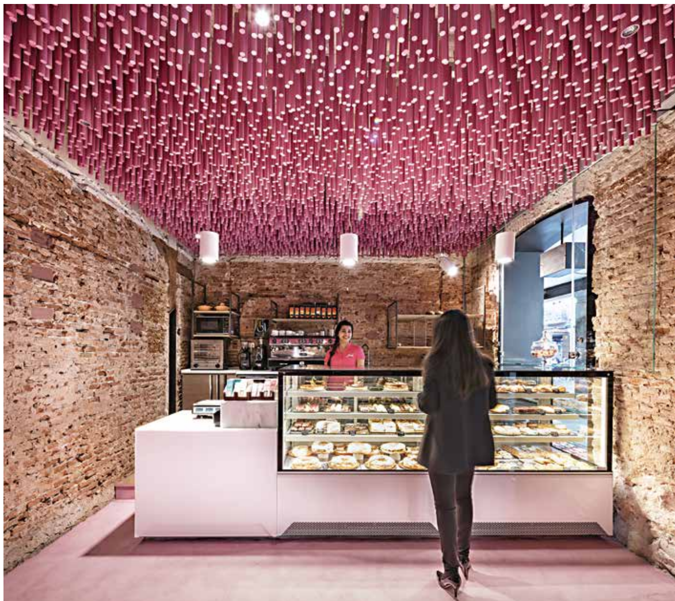
A gama VISTA da JORDÃO foi escolhida para equipar a nova padaria. The VISTA range from JORDÃO was selected to equip the new bakery.

The range boasts various versions: refrigerated (pastries, cakes, chocolates and frozen desserts), heated and neutral, including bread display. VISTA stands out for its design with straight lines and contemporary urban style. Efficiency is one of the strong points and comes from using double glazed glass which significantly reduces temperature fluctuations and loss and uses LED lighting which enables greater energy efficiency. The equipment's footprint has been optimised