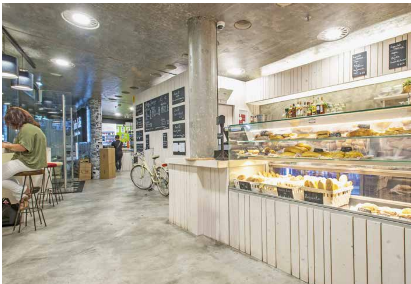
O Ordina Caffé é um dos projetos na área da restauração desenvolvidos pela Eduardo Verde. The Ordina Caffé is one of the projects in the catering area developed by Eduardo Verde.