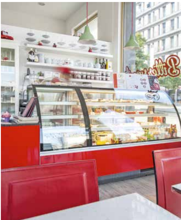
A pastelaria Choco & Mousse é outro dos projetos na área da restauração desenvolvidos pela Eduardo Verde.

The patisserie Choco & Mousse is one of the projects in the catering area developed by Eduardo Verde.