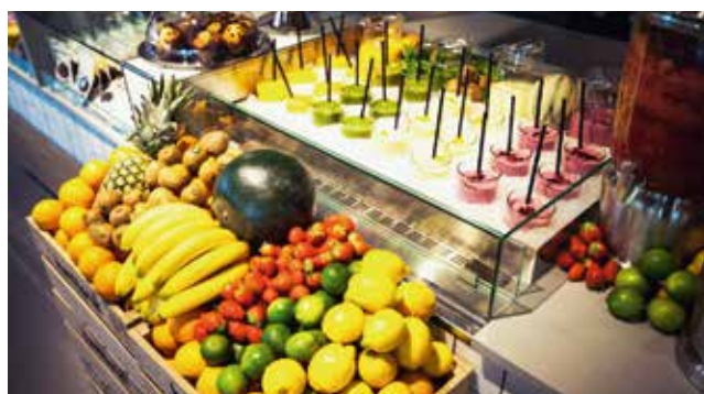
A empresa holandesa tornou-se distribuidora direta da JORDÃO. The Dutch company has become a direct JORDÃO distributor.

“A JORDÃO compreende os nossos requisitos e o equipamento é desenvolvido de acordo com as nossas necessidades e exigências. Esperamos, por isso, continuar a trabalhar em conjunto”, revelaram à COOL.