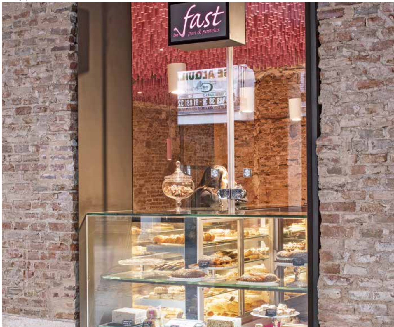
A VISTA destaca-se pelo seu design de linhas retas, estilo urbano e contemporâneo. VISTA stands out for its design with straight lines and contemporary urban style.